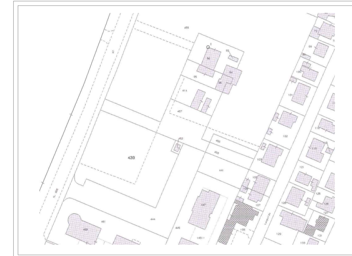
Planimetria Catastale foglio 96 mappali 92-93-94-95-96-414-455-456-457-458