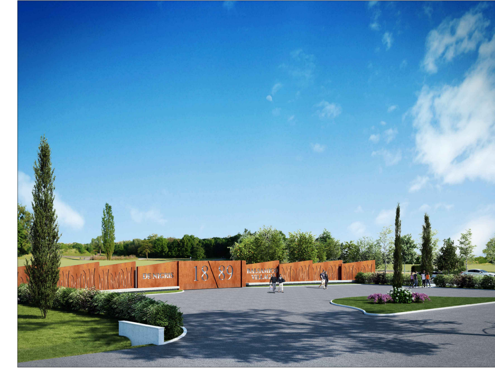
Viste prospettiche impianto di accesso