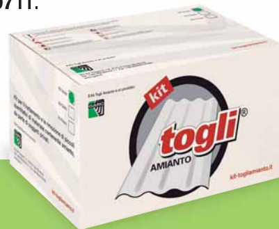
Kit Togli Amianto è un marchio registrato di prodotti e servizi, MO2006C000557 del 07 Maggio 2009.

Per informazioni su aspetti tecnici, costi dei kit, punti vendita, eventuali incentivi previsti, visitare il sito web kit-togliamianto.it o chiamare Garc SpA al numero 059 6310711 .